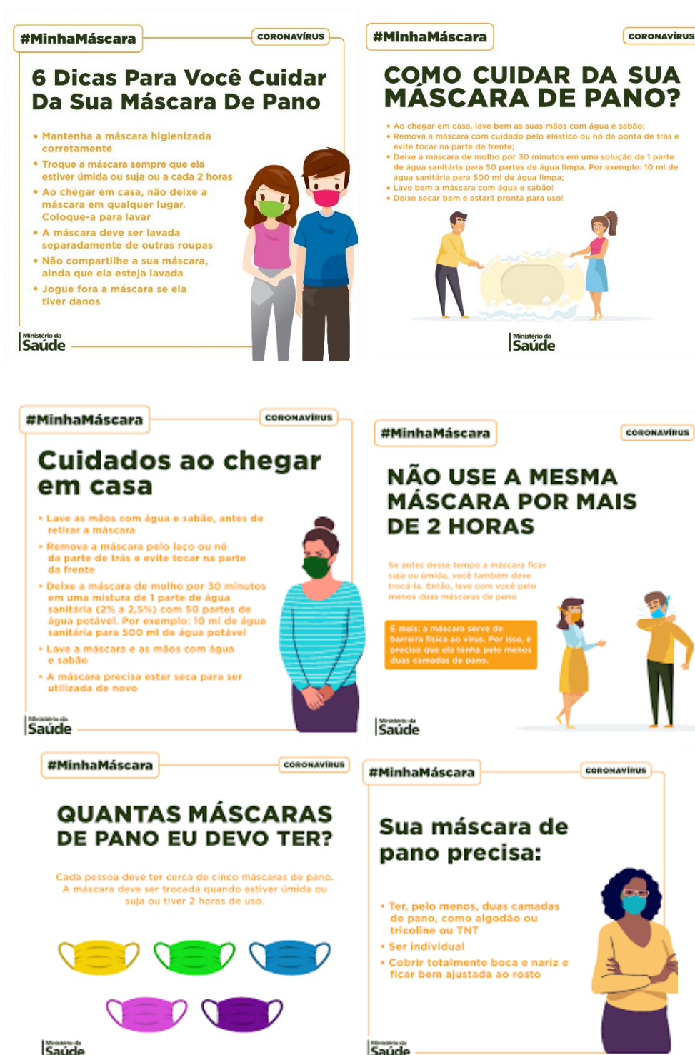
FIGURAS 3 a 6 - Materiais sobre o uso de máscaras caseiras do Ministério da Saúde

Originais disponíveis em: https://www.facebook.com/minsaude