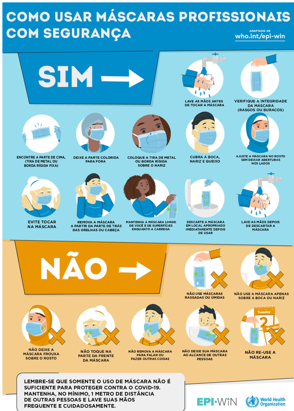
FIGURA 2 - Cartaz: Como usar máscaras profissionais com segurança

Original em inglês disponível para download em: https://www.who.int/emergencies/diseases/novel-coronavirus-2019/advice-for-public/when-and-how-to-use-masks